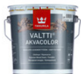
Valtti Akvacolor kuullote

Puuhun imeytyvä kuullote massiivihirsipinnoille (pyörö- ja höylähirsi). Super Color -sävyillä pidempi huoltoväli.